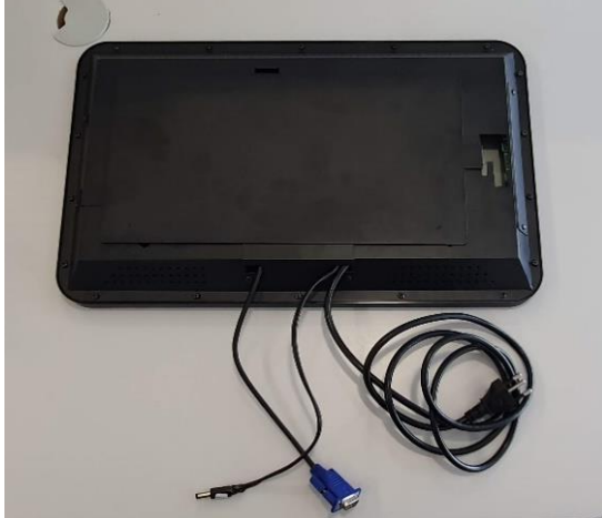
Cabos que acompanham o monitor

Especialmente Desenvolvido para uso em Elevadores