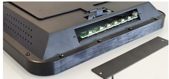
Acesso ao ajuste de brilho, contraste