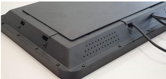
Portas de acesso para montagem vertical / horizontal